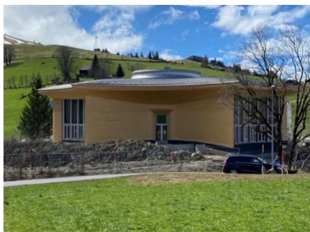
Klanghaus im Bau

Traditionsgemäss wurde anschliessend ein Nachtessen offeriert, begleitet von einem tollen Rahmenprogramm. Besonderen Applaus erhielt ein junges Berner Tanzteam «styleacrobats.ch», die akrobatischen Rock'n'Roll vorführten. War super!