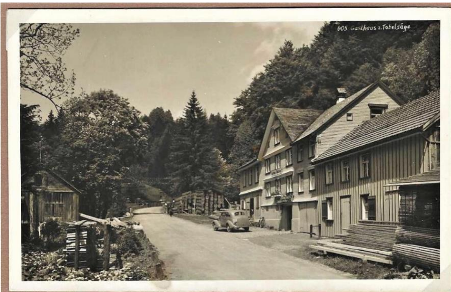
Tobelsäge Kartengruss nach Grabs am 17.8.1931