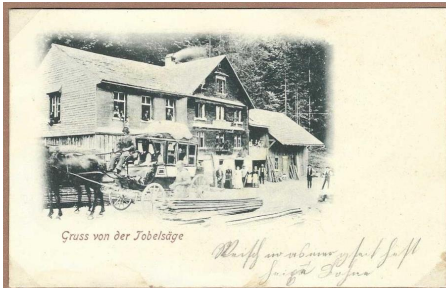
Gruss von der Tobelsäge

Gruss aus «Tobelsäge» Kartengruss nach München am 11.8.1921