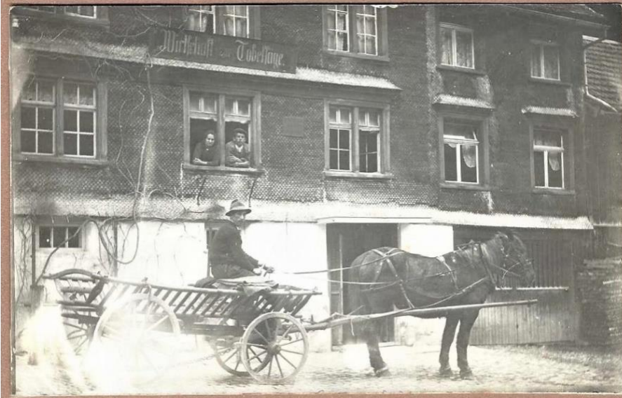
Fuhrwerk vor der Tobelsäge Gruss nach Trübbach am 14.1.1914