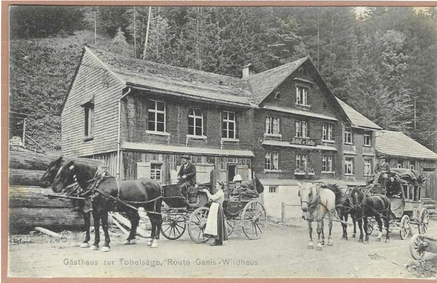
Rast vor dem Gasthaus zur Tobelsäge Grüsse nach Grabs am 24.8.1918